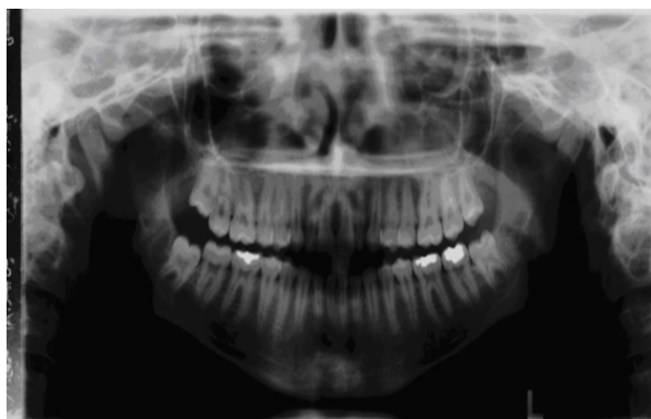
شکل ۳- رادیوگرافی پانورامیک. یک رادیولوژیست با بردر مشخص که در قسمت میانی فوران اینفراربیتال واقع شده است.

این سلول‌ها اغلب در رادیوگرافی‌های پانورامیک دیده می‌شوند (۵) (شکل ۳).