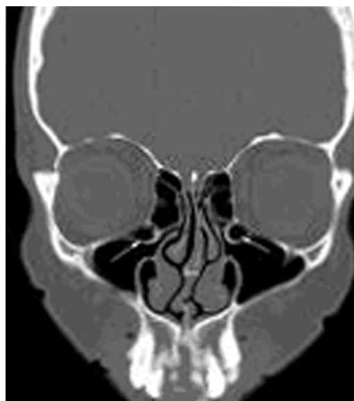
شکل ۱- CT کروئال، سلول‌های هوایی اینفراربیتال اتموئید دو طرفه را نشان می‌دهد.

این سلول‌ها پنوماتیزه شوند، می‌توانند باعث تنگ شدن infundibulum و ایجاد سینوزیت ماگزیلاری شوند، بنابراین این سلول‌ها از لحاظ کلینیکی یک واریاسیون آناتومیک مهم و قابل توجه هستند (۲،۳) (شکل ۲).